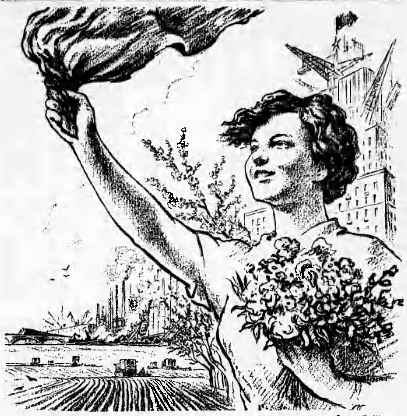
Рисунок Л. СМЕХОВА

ла же касается продуктов животноводства, тут нас даже Грязань не запугает... Вышло в том, что Октябрьский район вышел из зимы и вступил в первую весну семилетия, имея годовой запас нетронутых великопленных кормов: кукурузного силоса, сена, концентратов, не говоря уже о гуманных отходах. Иным коренным степнякам это кормовое богатство до сих пор кажется фантастическим. Однако все поняли, что труднейшая из степных проблем — кормовая проблема — благодаря кукурузе решена раз и навсегда. Брали тут шестсот литров молока от коровы в год, считали, что больше и нельзя взять в «выпасной» степи. Теперь берут в среднем 2 200 литров, на них фермеры перешли за три тысячи. Мне пришлось наблюдать сев ранних колосковых в совхозе Придонском. Трактор тянет на сене целый агрегат из седелок, и нет на саялах ни одного прицепника. Изредка и селянам подбегает грузовик-автомобильчик. От бунера в саялке набегает такая длинная деревянно-жестяная шея, заряжает