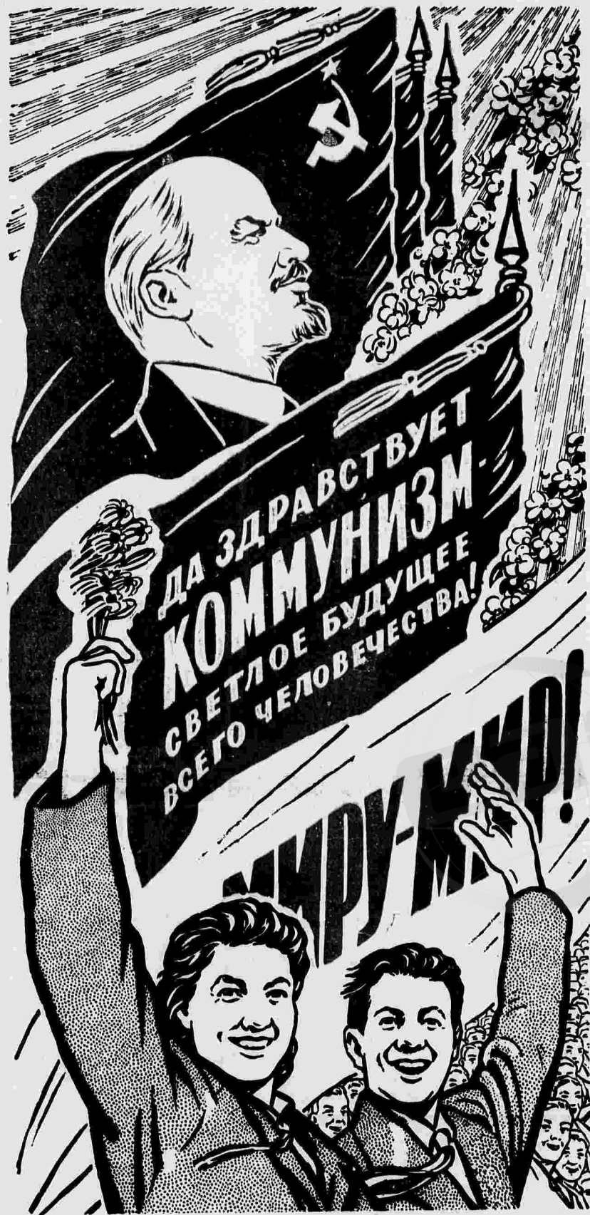
Рисунок Б. Березовского.