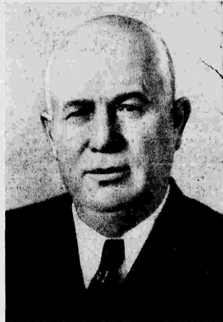
Никита Сергеевич ХРУЩЕВ