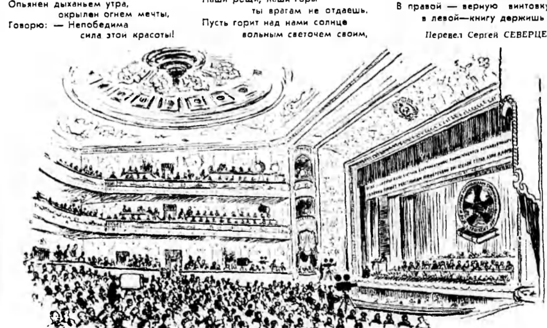
Пятый день работает великая ассамблея писателей стран Азии и Африки. На зрительный зал Театра имени Назома, где происходят пленарные заседания, всегда полно. Это и понятно: впервые в истории встретились писатели двух континентов, товарищи по борьбе за мир, против колониализма.

В правой — верную винтовку, в левой — книгу держишь ты! Перевел Сергей СЕВЕРЦЕВ